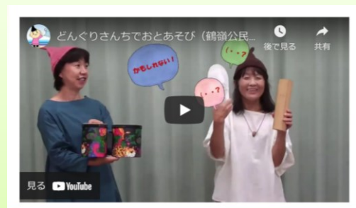
「どんぐりさんちでおとあそび」（鶴嶺公民館） https://youtu.be/RfOO4fuSx1g