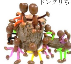
どんぐりさん作 ドングリちゃんたち