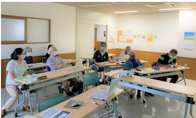
説明後の意見交換の様子 (茅ヶ崎地区コミュニティセンター会場)

記念事業の基本方針、目的、体制(案)、概要が説明され、事業候補として、①さぼちがアーカイブの整備(収集・整理・保存)、②さぼちが創立 20 周年記念誌「さぼちが 20 年の歩みとこれから(仮称)」発行、③さぼちがの将来像の策定、④社会貢献活動