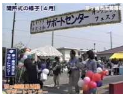
オープニングフェスタ(4/14)