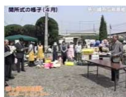
オープニングフェスタ(4/14)