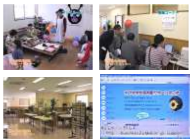
プレイルーム 情報コーナー リースペース ホームページ