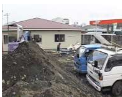
工事中のサポセン