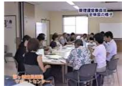
管理運営委員会全体会の様子(7/17)