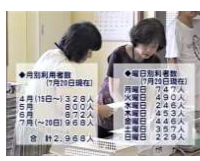
利用者数 開所4ヵ月で3千人に