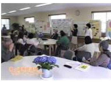
サポセン未来予想図3分'ルースピーチ