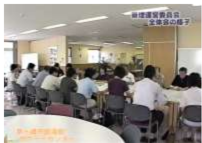
管理運営委員会全体会の様子(7/17)